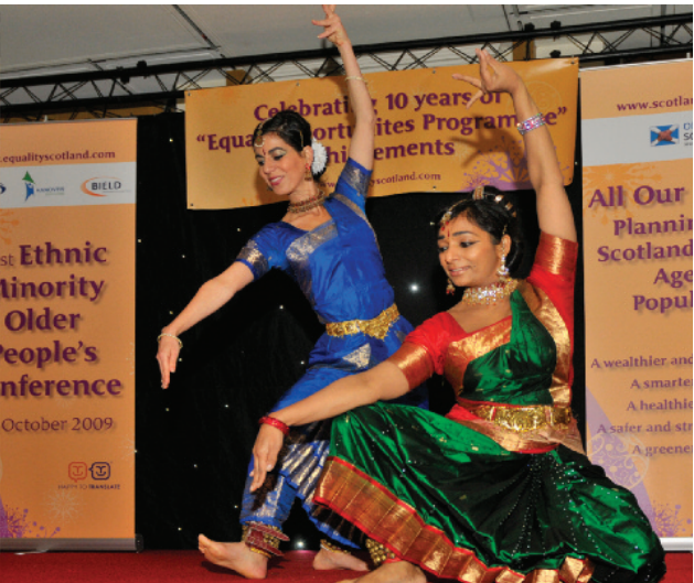
ভারতীয় ঐতিহ্যবাহী নৃত্য